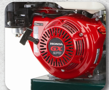
Floating Saddle Decreases Vibration